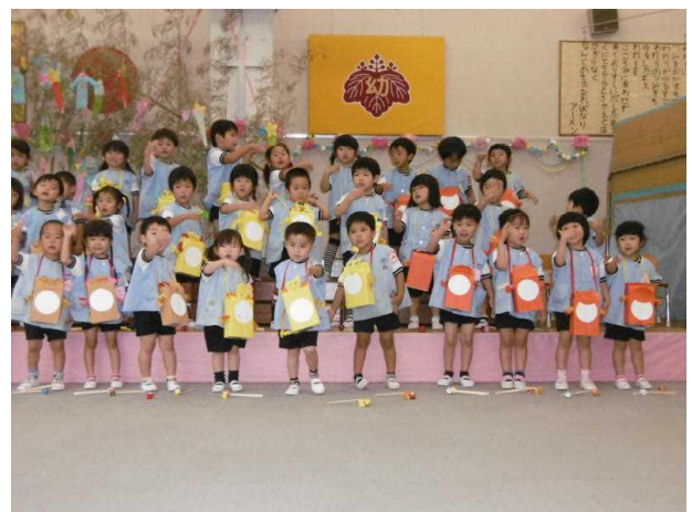
【年少】たいこが いいね！