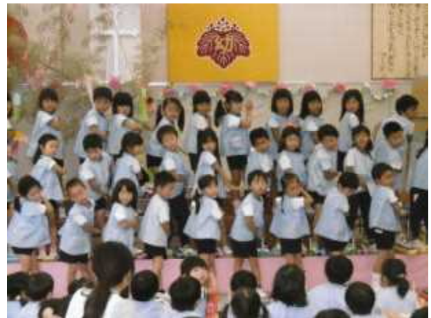
【年長】堂々とした姿 大きな拍手!