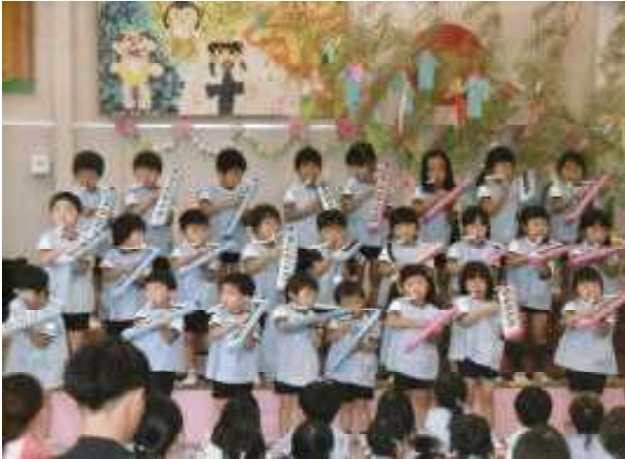
【年中】鍵盤ハーモニカ 楽しいよ