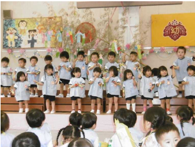
【たんぽぽ・ひよこ】できたよ！